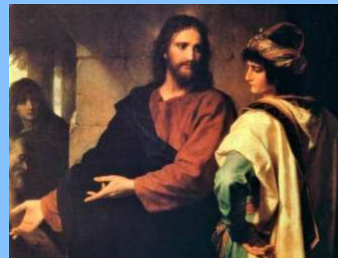
Gesù e il giovane ricco (Johann Michael Ferdinand Heinrich Hofmann, 1889)

- Nel rinnovamento dei Tempi forti dello Spirito -